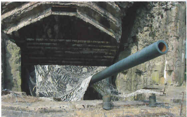
En av de stora kanonerna vid "Batterie de Crisbecq" som tillhörde Atlantvallen.

Mont-Saint-Michel, ofta fotograferat objekt, med ställplats strax bredvid på f.d. havsbotten.