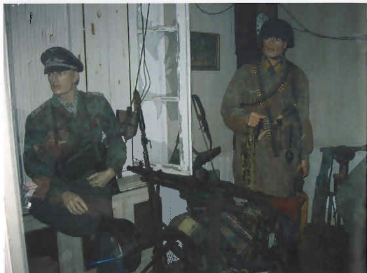
Ett av rummen på "Dead Man's Corner"